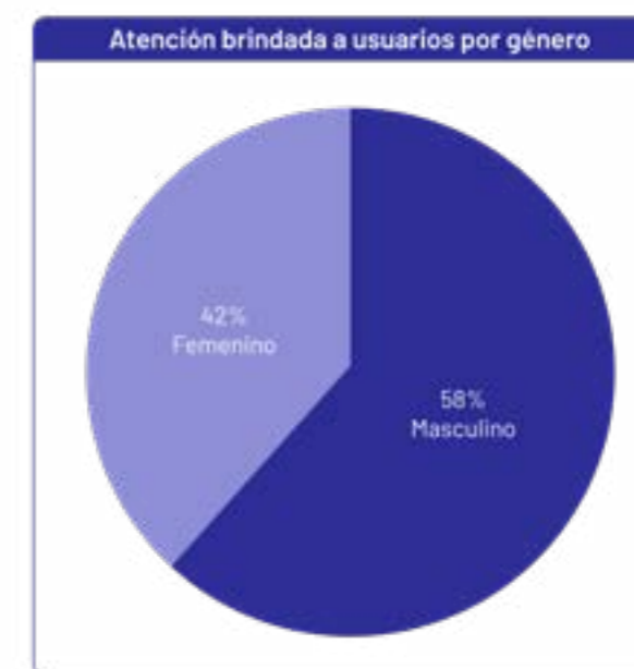
Ilustración 2 Atención brindada a Usuarios por Género

Se brindó atención a 3.763 usuarios y usuarias de los cuales 2.178 eran de género masculino y 1.585 de género femenino.